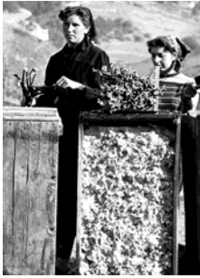
Pépinière près de Martigny, vers 1970.