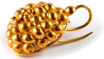
Boucle d'oreille en or, finement ouvragée, en forme de grappe de raisin, Massongex, thermes romains, 1er siècle. Musée d'histoire, Sion.