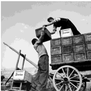
Vendanges à Ardon, vers 1947.

La coopérative Provins est la première à introduire l'usage de la caissette en bois, dès 1930.