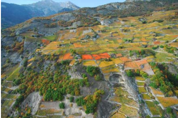
Paysage de vigne.