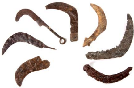
Serpettes romaines découvertes en Valais, IIe siècle-VIIe/VIIIe siècles apr. J.-C.

Archéologie cantonale et Musée d'histoire, Sion