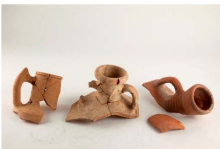
Cols d'amphore de la région de Rhodes (Massongex, 50-70 apr. J.-C.), du Sud de la Gaule (Martigny, 50-100 apr. J.-C.) et de Crète (Martigny, IIIe siècle apr. J.-C.).