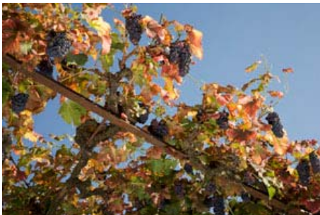
Treille de Cornalin à Ollon (VS).