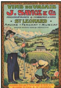
Affiche publicitaire , vers 1920. Médiathèque Valais-Sion.