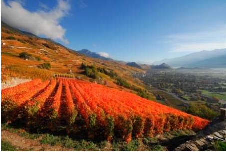
Paysage de vigne.