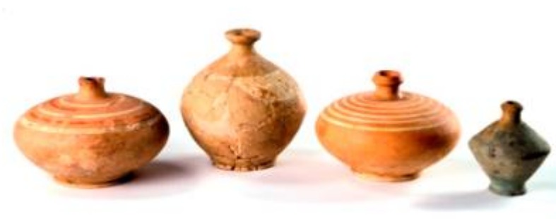
Vases a trottola. De gauche à droite, Sembrancher, Sion, Sembrancher et Riddes. Ce dernier est une imitation de forme réduite, modelée en pâte locale. Le récipient le plus haut est une forme précoce de vase a trottola, datée du début du 2ème siècle av. J.-C.