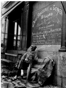
Devant le Café brasserie de Genève. Sion, 1890-1900.

On distingue les noms de quelques-uns des vins vendus dans ce débit de boisson: Clos Molignon, Clos du Mont, Clos Grandinaz, Château la Soie.